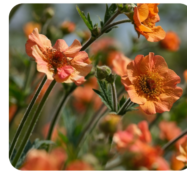
Plantas com flor

As plantas com pinha são maioritariamente árvores e arbustos, produzem a semente dentro de pinhas.