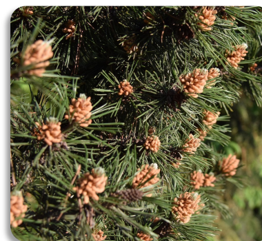
Plantas com pinha

Pequenas plantas que crescem em locais húmidos e absorvem água diretamente, pois não têm vasos condutores.