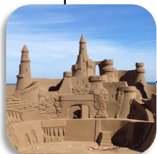
Castelo de areia