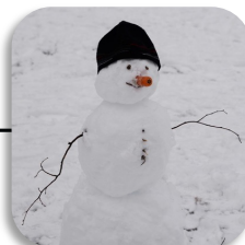
Boneco de neve