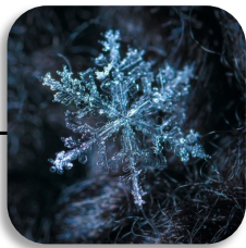
Cristal de gelo