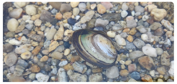
Almeijão-pequeno Anodonta anatina