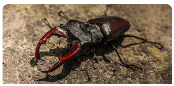
Vaca-loura Lucanus cervus