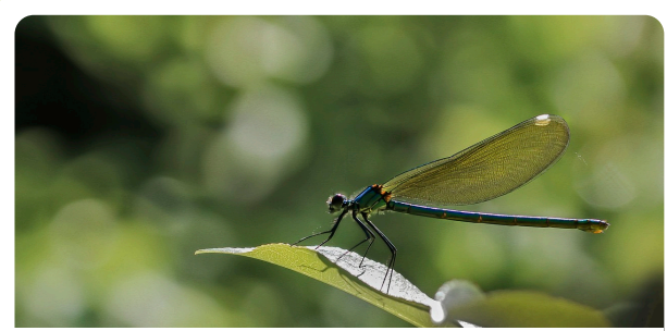
Libélula-esmeralda Oxygastra curtisii