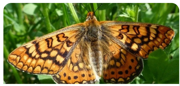
Fritilária-dos-lameiros Euphydryas aurinia