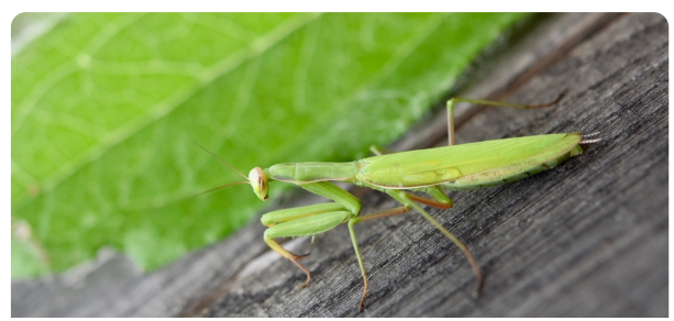
Louva-a-deus Apteromantis aptera