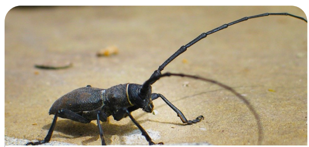
Besouro-capricórnio Cerambyx cerdo